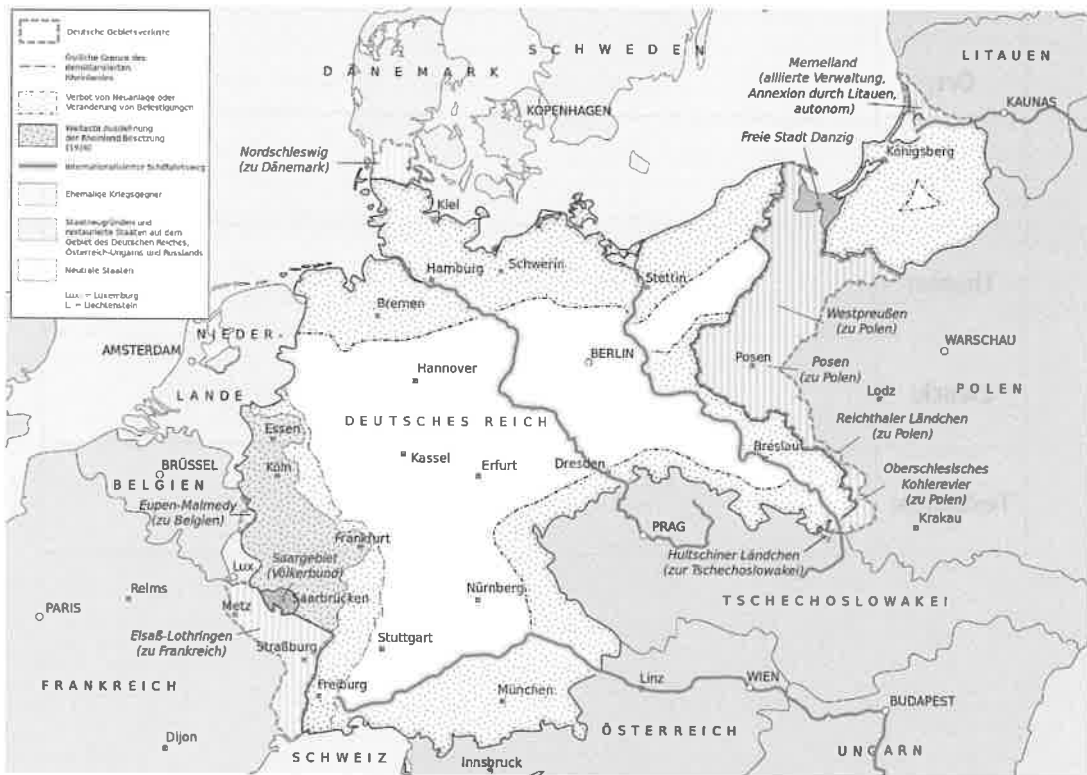
Matthias Küch [CC BY-SA 3.0 ( http://creativecommons.org/licenses/by-sa/3.0/ )], via Wikimedia Commons.

unterstützende Fragen zum Lesen der Karte (hier nicht sprachbildender Fokus)