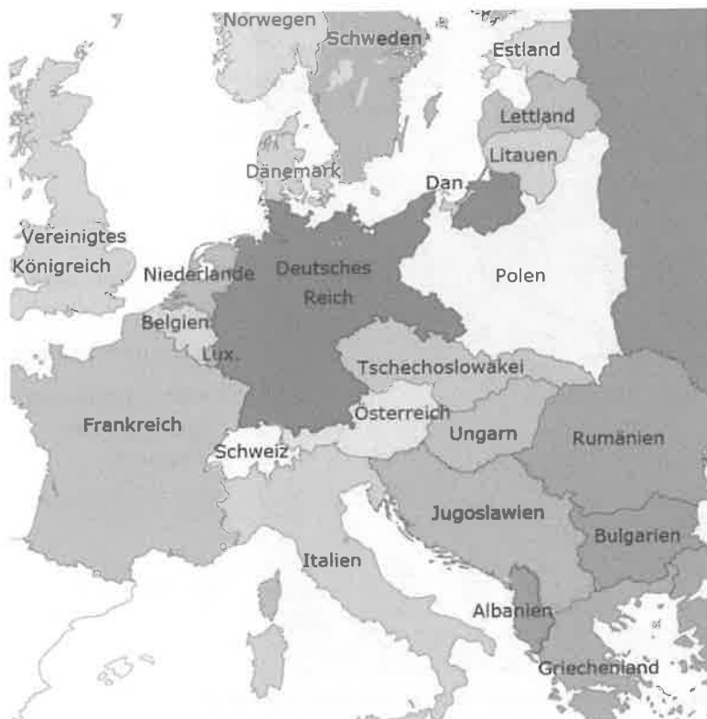
Kartenausschnitt, leicht geändert.