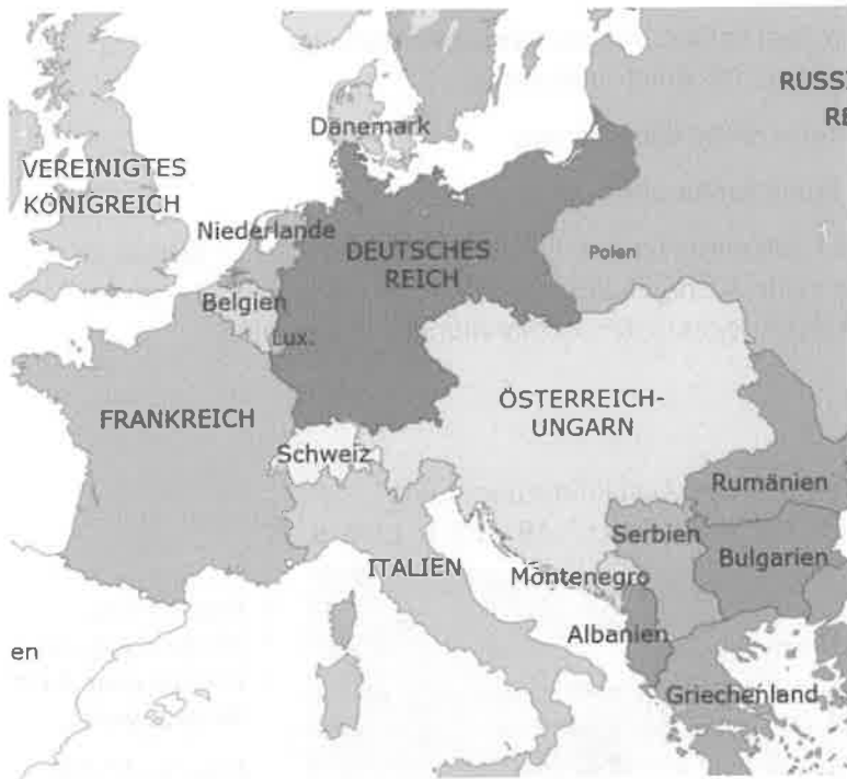
Furfur Blank map of Europe 1914.svg: Alphathon (Blank map of Europe 1914.svg) [CC BY-SA 3.0 ( http://creativecommons.org/licenses/by-sa/3.0/ )], via Wikimedia Commons. Kartenausschnitt.